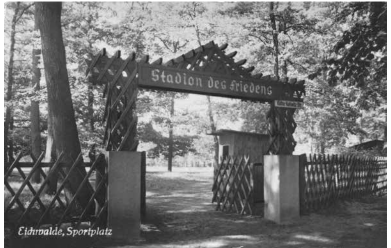
Alter Eingang 1958

Viele freie Flächen bot Eichwalde nicht. Man entschied sich für den Eichenpark auf der Westseite der Bahn. Eigentlich sollte dieses unbebaute und wild zugewachsene Areal zwischen der Stadionstraße und bis fast zur Schulendorfer Straße hin nie bebaut werden. Die Gründungsväter wollten den sogenannten Eichenblock, auch Eichkamp und zu Kaisers Zeiten Viktoriapark genannt, in seinem ursprünglichen Zustand belassen. Er sollte ein