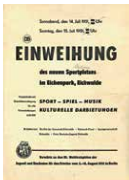
Plakat Einweihung Stadion 1951